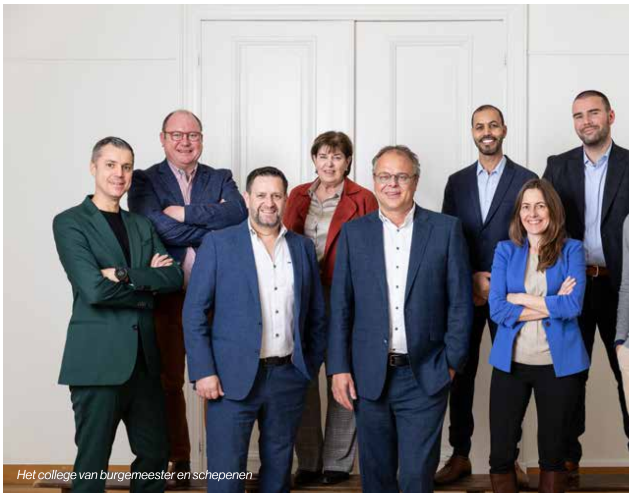
Het college van burgemeester en schepenen

Meer info volgt in de volgende editie van infoLeeuw of vind je binnenkort via www.sint-pieters-leeuw.be/lentedrink .