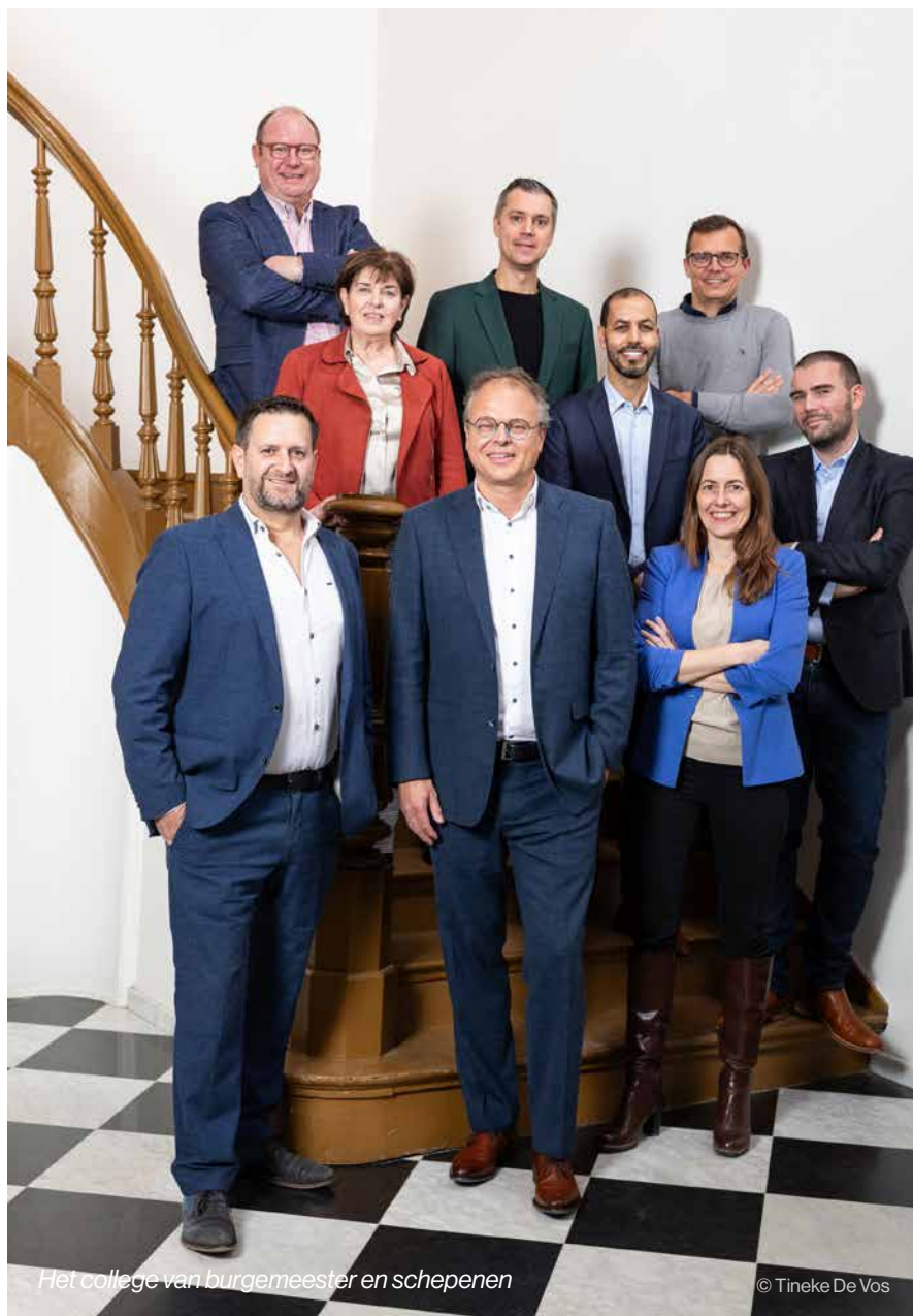
Het college van burgemeester en schepenen

De federale gezondheidsinspecteur van Vlaams-Brabant besliste in samenspraak met de ziekenhuizen dat er in geen enkel ziekenhuis patiënten