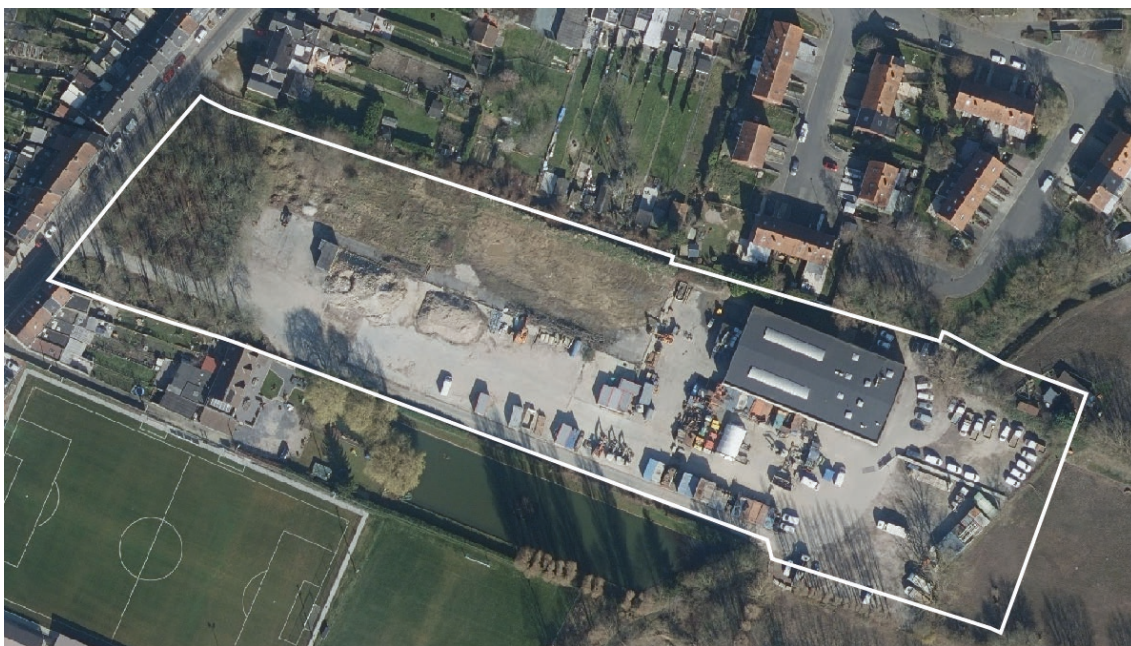
| Aanduiding plangebied op microschaal

Op heden wordt het plangebied bijna volledig bezet door een bedrijf. De gemeente Sint-Pieters-Leeuw wenst hier echter de mogelijkheid te voorzien een woonproject te kunnen realiseren met gevarieerd woonaanbod. Er dient hiervoor specifiek aandacht gegeven te worden aan efficiënt ruimtegebruik, een correcte landschappelijke invullen, een goed regenwaterbeheer en het herstel van de relatie met de achterliggende beemden door het opnieuw openleggen van de Lotbeek. Een bestemmingswijziging van het plangebied dringt zich bijgevolg op.